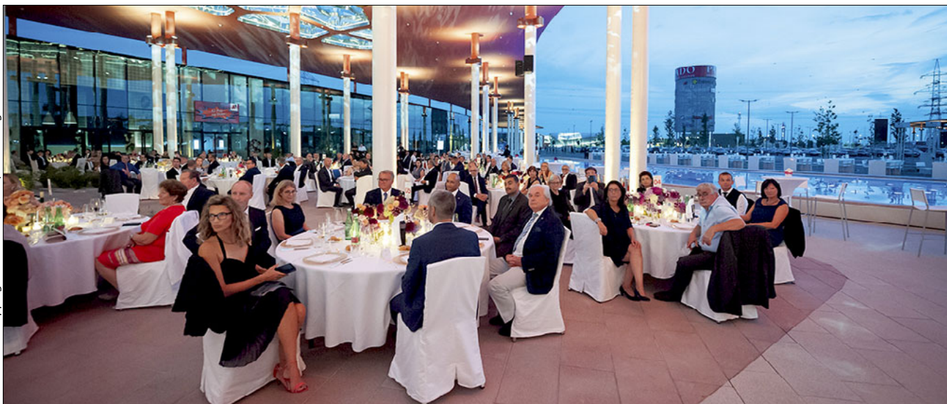
Ein Blick auf die Corona-bedingt zahlenmäßig sehr eingeschränkte Zahl der Festgäste anlässlich der feierlichen Eröffnung